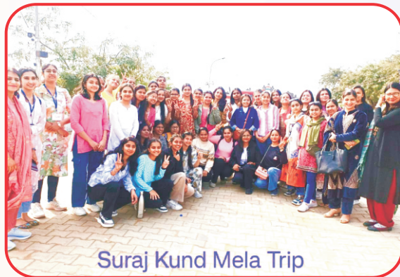
Suraj Kund Mela Trip