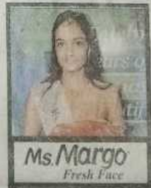
Ms. Margo Fresh Face