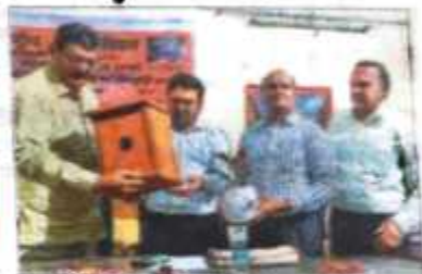
एनएस ग्रामी कॉलेज में विश्व गौरैया दिवस पर कार्यक्रम हुआ।