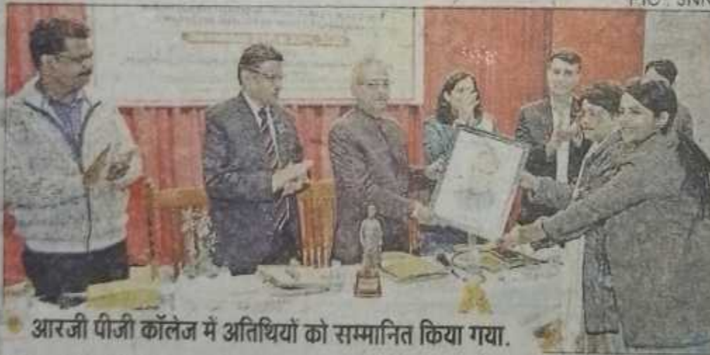
आरजी पीजी कॉलेज में अतिथियों को सम्मानित किया गया।

MEERUT (21 Dec, JNN): समाज का चलाने के लिए पैसे से ज्यादा ज्ञान की आवश्यकता है, शिक्षा से ही अच्छे समाज का निर्माण होता है. देश की उन्नति के लिए शिक्षा देने वाले शिक्षकों का व्यवहार सहज सरल और पूर्ण रूप से प्रशिक्षित होना आवश्यक है. मस्तिष्क के साथ साथ दिल में भी नियमों का पालन करने के लिए सभी शिक्षकों को तैयार रहना चाहिए. चरित्रवान शिक्षक ही चयनित हो भारत को विश्व गुरु बनाने