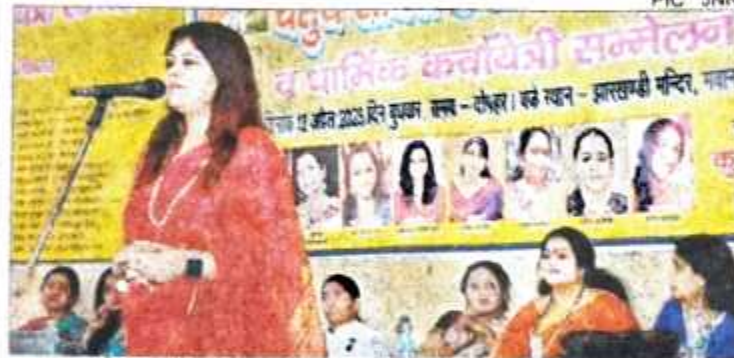
● झारखंडी शिव मंदिर में आयोजित कवयित्री सम्मेलन रचना प्रस्तुत करती कवयित्री.