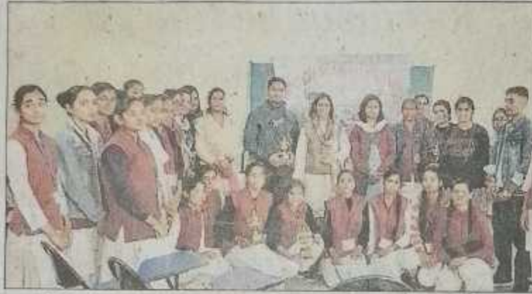
आरजीपीजी कॉलेज में शनिवार को प्रतियोगिता का आयोजन किया गया।

छात्रों ने ली संविधान की शपथ : सुभाष बाजार स्थित बीएवी इंटर कॉलेज में संविधान दिवस पर अध्यापिकाओं एवं छात्रों ने संविधान के अनुरूप कार्य करने की शपथ ली।