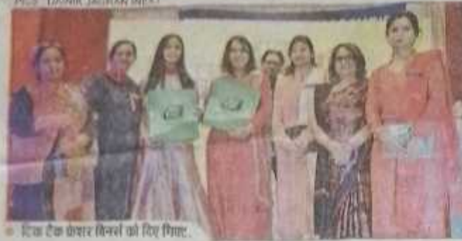
टिक टैक फ्रेशर विजेताओं को दिए गए।