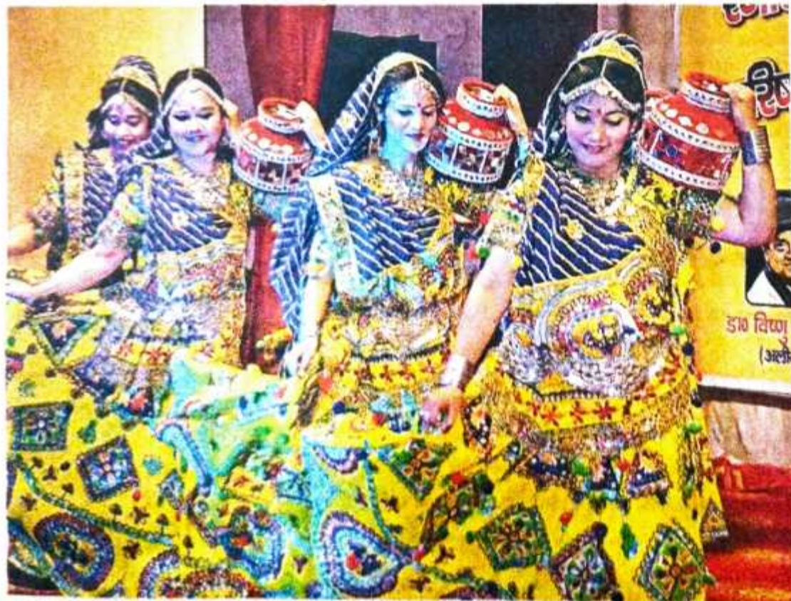
आरजी पीजी कालेज में आयोजित कार्यक्रम में छात्राओं की सांस्कृतिक प्रस्तुती ने सबका मन मोह लिया • जागरण