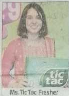
Ms. Tic Tac Fresher

मिस टिक टैक फ्रेशर के लिए स्टूडेंट्स ने रीप बॉक, गाने गाए, परसेलिटी