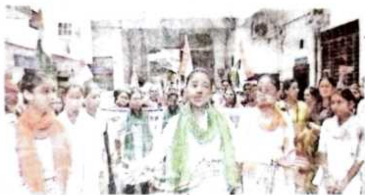
इन्स्टीट्यूट डीग्री कालेज में नाटक का मंचन करती छात्राएं

शहीद मंगलपांडे पीजी कालेज में हर घर तिरंगा अभियान के तहत स्वतंत्रता आंदोलन में मातृशक्ति की भूमिका विषय भूमिका निर्वहन प्रतियोगिता का आयोजन किया गया। छात्राओं ने राणी लक्ष्मीबाई,