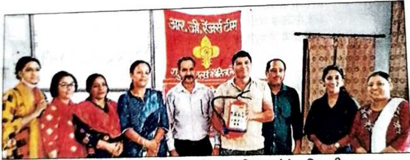
आरजी पीजी कॉलेज में अग्निशमन यंत्र का प्रशिक्षण देते अधिकारी। संवाद