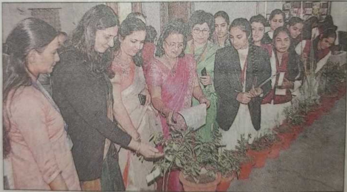
आरजी पीजी कॉलेज में कार्यशाला के दौरान पौधों की जानकारी लेती शिक्षिकाएं व छात्राएं।