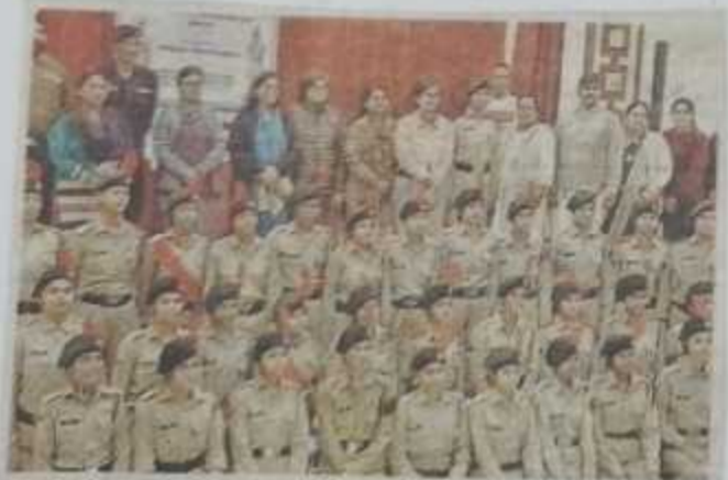
आरजी पीजी कालेज में एनसीसी सत्र 2022-23 की पहली परेड हुई। साथ ही रैक संरेमनी और एएनओ पेरेंट्स कैडेट्स मीट का भी आयोजन किया। - सी कालेज प्रबंधन