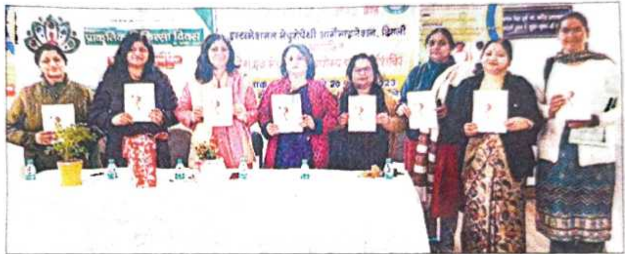
आरजी पीजी कॉलेज में आयोजित कार्यक्रम में मौजूद अतिथि। संवाद