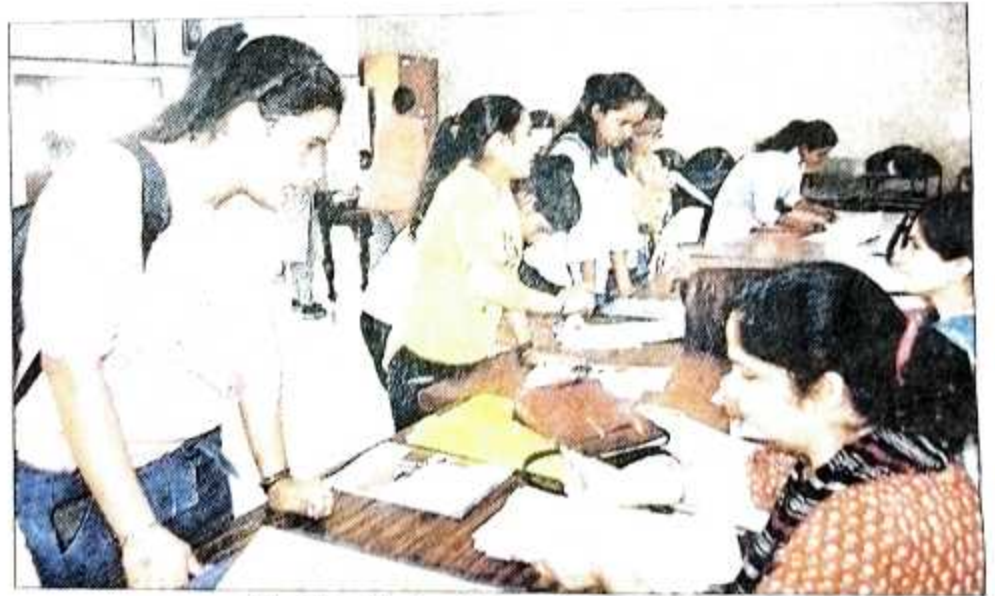
आरजी कॉलेज में प्रवेश लेने पहुंची छात्राएं।