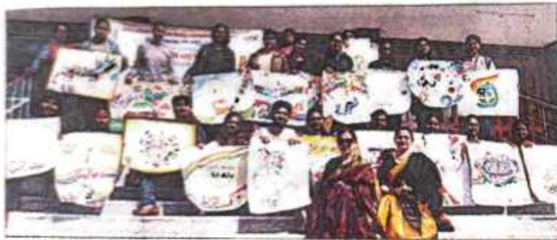
पोस्टर प्रतियोगिता में भाग लेते छात्र-छात्राएं। संवाद