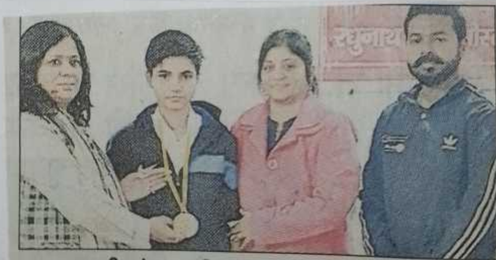
खुशी को सम्मानित करतीं शिक्षिकाएं। संवाद