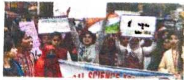
रैली निकालतीं आरजी कॉलेज की छात्राएं। संवाद