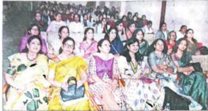
भारजी डिग्री कॉलेज में आयोजित कार्यक्रम में मौजूद अतिथि। संवाद

यही कौशल विकास प्रकोष्ठ के अंतर्गत मिलाई संबंधी मकुशल प्रशिक्षण कोर्स संपन्न हुआ। प्राचार्य प्रो. निर्वोदिता