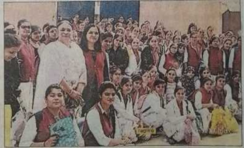
सीसीएसयू के भ्रमण के दौरान मौजूद आरजी कॉलेज की छात्राएं। संवाद