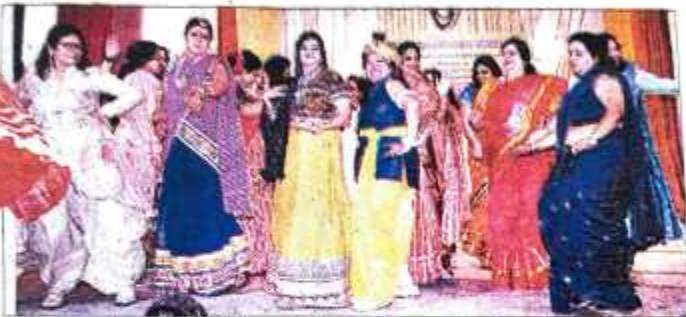
आरजी पीजी कॉलेज में पुरातन छात्र कार्यक्रम में नृत्य की प्रस्तुति देती छात्रा तथा इस करती पुरातन छात्राएं व शिक्षकाएं। स्वतः