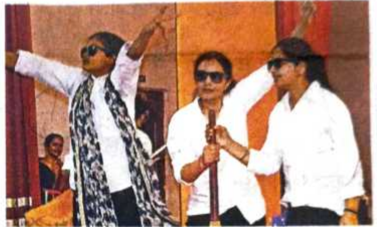
आरजी पीजी कालेज में कार्यक्रम प्रस्तुत करती छात्राएं