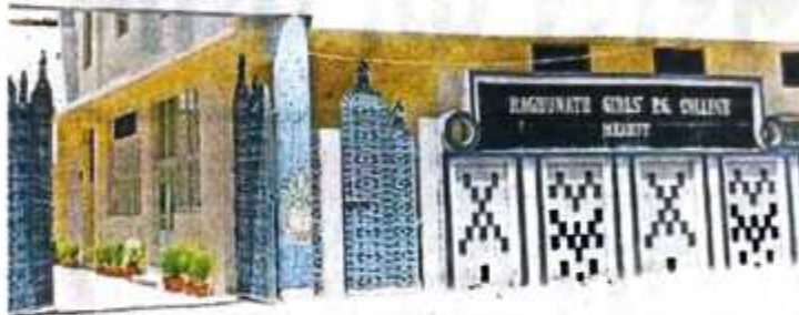
पश्चिमी कचहरी मार्ग स्थित आरजी पीजी कालेज का भवन • जागरण

जागरण संवाददाता, मेरठ : क्रांति शहर मेरठ ही नहीं पश्चिमी यूपी को लाखों छात्राओं की पहली पसंद व शहर के प्रतिष्ठित आरजी पीजी कालेज का सफर स्वर्णिम रहा है। कालेज सोमवार को अपना स्थापना दिवस मना रहा है। इन 75 सालों के सफर में शिक्षा रूपी यह पौधा आज कटकृक्ष बन गया है। यहां से लाखों छात्राएं शिक्षा प्राप्त करके विभिन्न क्षेत्रों में कालेज का नाम रोशन कर रही हैं।