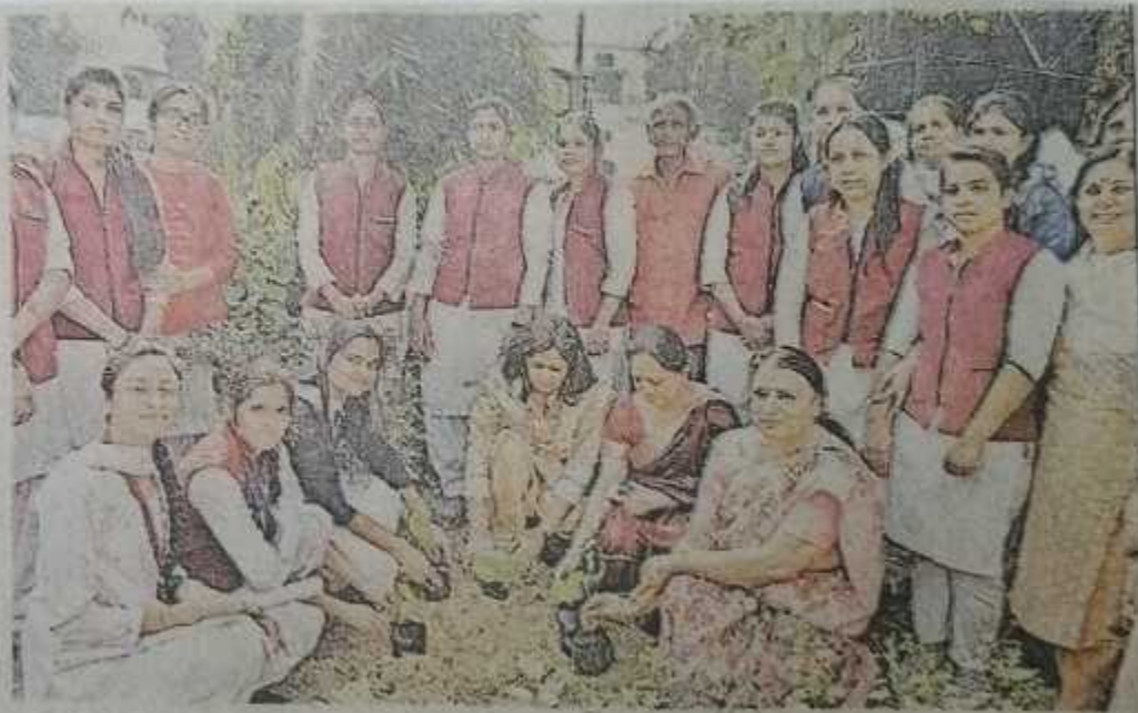
आरजी पीजी कालेज में पौधारोपण करती शिक्षिकाएं व छात्राएं