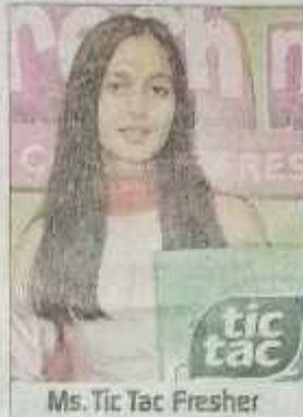
Ms. Tic Tac Fresher