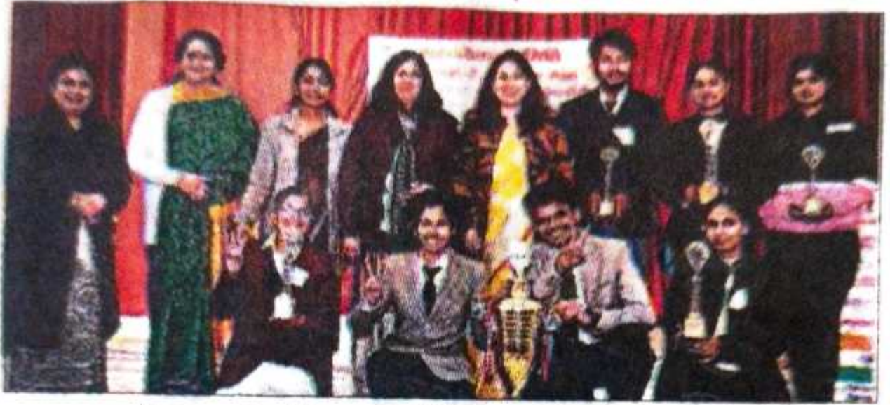
वाद-विवाद प्रतियोगिता की विजेता छात्राएं व शिक्षिकाएं। संवाद