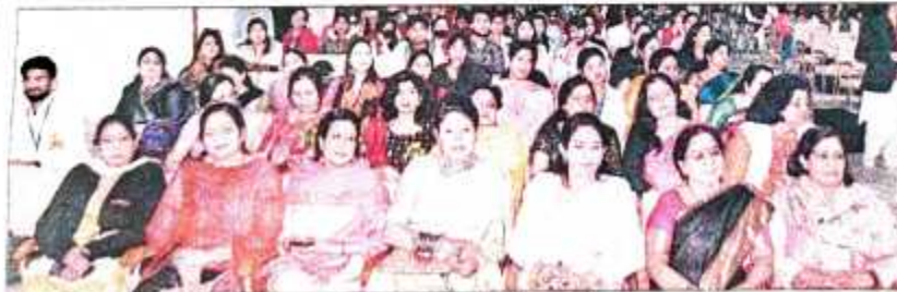
आरजीपीजी कॉलेज में चल रहे युवा महोत्सव में मौजूद शिक्षिकाएं व छात्राएं। संवाद