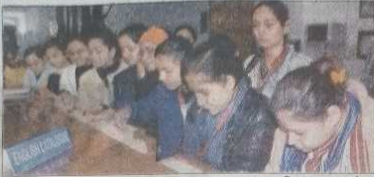
● जनवाणी संवाददाता, मेरठ