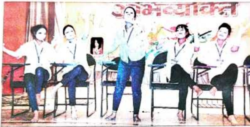
आरजीपीजी कॉलेज में चल रहे युवा महोत्सव में गीत की प्रस्तुति देती छात्राएं।