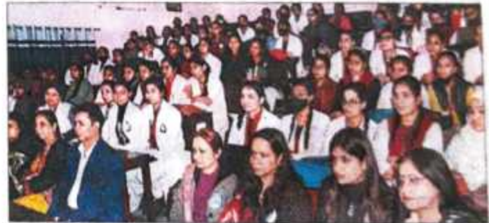
भारजी डिग्री कॉलेज में आयोजित कार्यक्रम में मौजूद छात्र-छात्राएं।