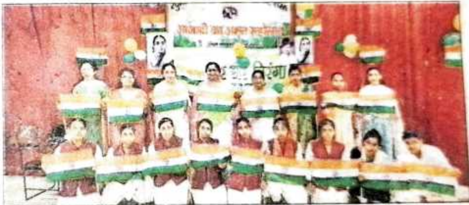
आरजी कालेज में कार्यक्रम की प्रस्तुति देती छात्राएं।

इसके अलावा बीडीएस इंटरनेशनल, जीटीबी स्कूल, सेंट मेरी व सोफिया गर्ल्स स्कूल में भी सांस्कृतिक कार्यक्रमों की धूम रही। एनएएम इंटर कालेज, डीएन इंटर कालेज, कंके इंटर कालेज, श्री मल्हू सिंह मटौर आर्य कन्या इंटर कालेज, आरजी कन्या इंटर कालेज, खालसा गर्ल्स इंटर कालेज, मार्टिन पब्लिक