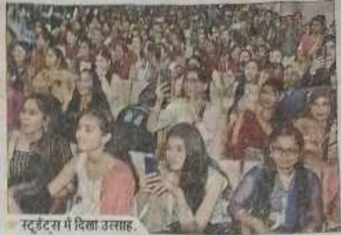
स्टूडेंट्स में दिखा उत्साह।