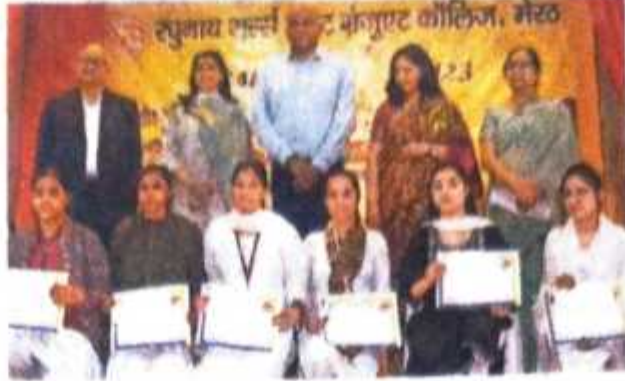
आरजी पीजी कालेज में आयोजित कार्यक्रम में सम्मानित हुई छात्राएं • जागरण