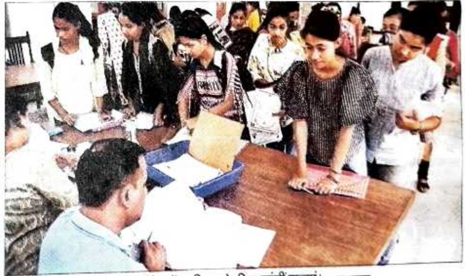
आरजी कॉलेज में एडमिशन के लिए पहुंची छात्राएं।

मेरठ कॉलेज में मंगलवार को दूसरे दिन भी ऑनलाइन एडमिशन शुरू नहीं हो पाए। बुधवार को पहली मेरिट से एडमिशन का अंतिम दिन है,