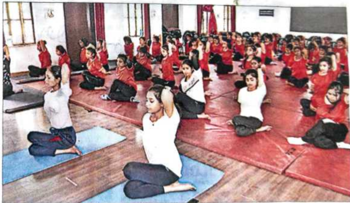
रघुनाथ गर्ल्स पीजी कॉलेज में आयोजित किए गए शिविर में योगासन करती छात्राएं।