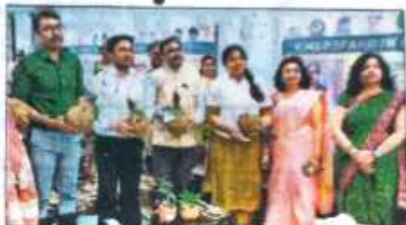
बीडीएस इंटरनेशनल स्कूल में गौरैया के संरक्षण का संदेश दिया गया।