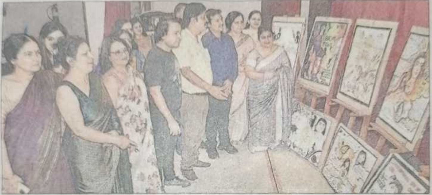
आरजीपीजी कॉलेज में लगी प्रदर्शनी देखते अतिथि व शिक्षक-शिक्षिकाएं। संवाद

मेरठ। रघुनाथ गर्ल्स पीजी कॉलेज में बेटी बचाओ बेटी पढ़ाओ अभियान के तहत 'सेलिब्रेट द लाइफ स्टॉप फीमेल फेटिसाइड' विषय पर संगोष्ठी हुई।