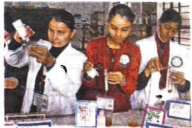
भारतीय प्रौद्योगिकी संस्थान दिल्ली में जांच के दौरान एक वैज्ञानिक जांच कर रहे हैं।

भारत सरकार की एक टीम ने दिल्ली में एक फूड प्रोसेसिंग प्लांट में जाकर जांच की। टीम ने लाल मिर्च पाउडर में ईट का चूरा और धनिया में लकड़ी का बुरादा पाया।