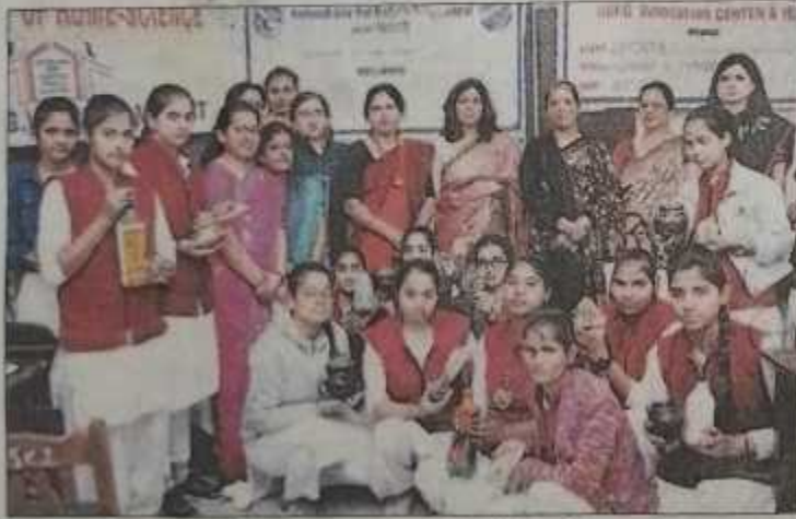
हस्तशिल्प सामग्री के साथ आरजी पीजी कॉलेज की छात्राएं। संवाद