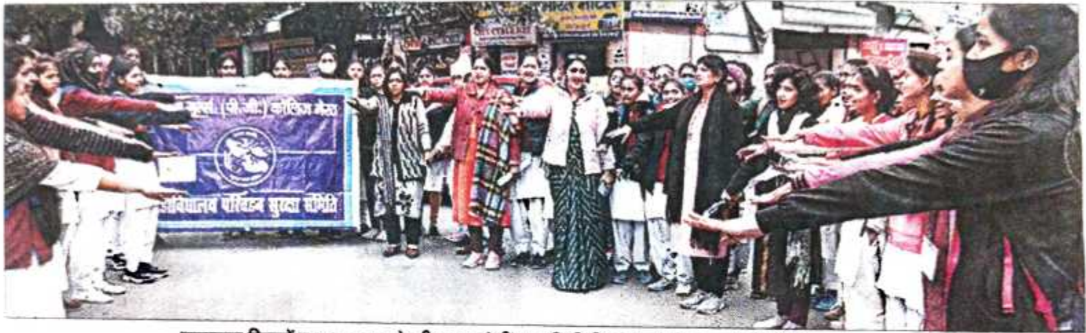
यातायात नियमों का पालन करने की शपथ लेतीं आरजी पीजी कॉलेज की छात्राएं और शिक्षिकाएं। संवाद

मेरठ। आरजी पीजी कॉलेज में मंगलवार को परिवहन समिति द्वारा सड़क सुरक्षा जागरूकता अभियान के अंतर्गत छात्राओं ने मानव श्रृंखला का निर्माण किया। इसमें छात्राओं ने सड़क सुरक्षा जागरूकता संबंधी नारे लगाए। सड़क यातायात के नियमों का पालन करने की शपथ ली।