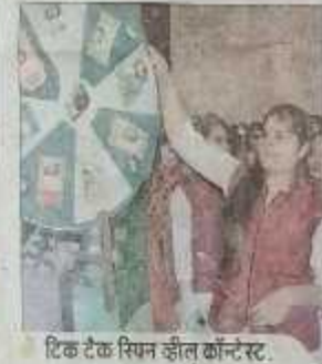
टिक टैक स्पिन व्हील कॉन्टेस्ट