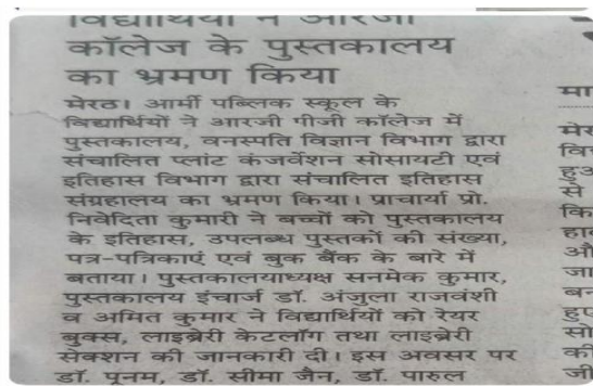
Amar ujala 30.4.2023 Page no.06 11:30 am