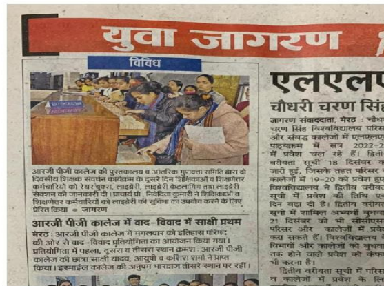
Hindustan 30.04.2023 Page no.04 11:36 am