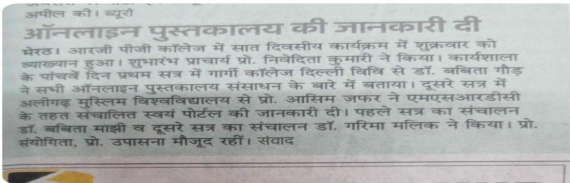
Amar ujala 29.04.2023